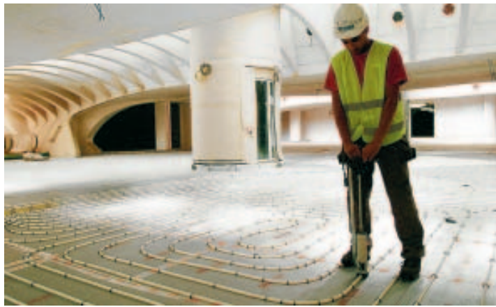
Les tuyaux sont placés à 20 cm d'intervalle. ■ CRAHAY

"Et aussi plus économique, renchérit Luc Brants, responsable du chauffage par le sol chez Rad-