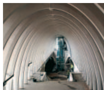
Wust a participé au gros-œuvre.

ciation momentanée qui a exécuté le gros-œuvre, le lot n° 2. Il s'agit des constructions en béton, pas de la haute structure métallique. Wust a réalisé les bâtiments des voyageurs, les nouveaux quais et les nouvelles voies. Elle a aussi participé à la modernisation des caténaires, à la démolition de l'ancienne gare et à la réalisation de la gare provisoire.